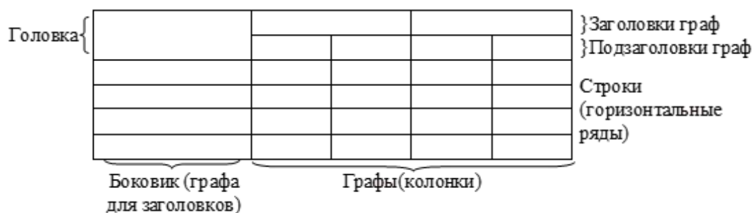
Таблица _ - номер название таблицы

Заголовки граф, как правило, записывают параллельно строкам таблицы. При необходимости допускается перпендикулярное расположение заголовков граф. Допускается применять размер шрифта в таблице меньший, чем в тексте.