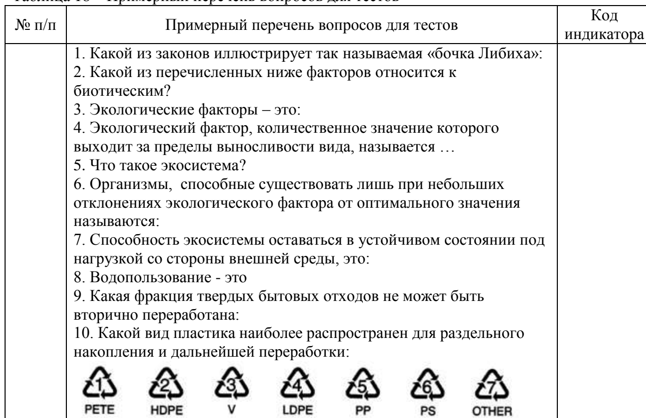
Таблица 18 – Примерный перечень вопросов для тестов

Перечень тем контрольных работ по дисциплине обучающихся заочной формы обучения, представлены в таблице 19.