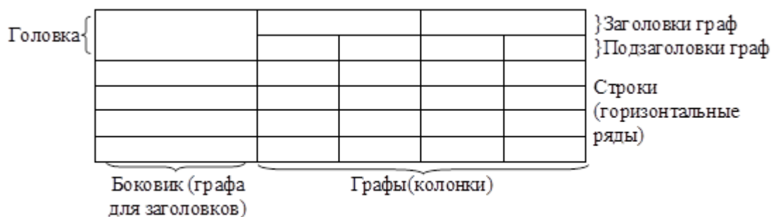
Рисунок 1 - Пример оформления таблицы

Таблица _____ - _____ номер название таблицы