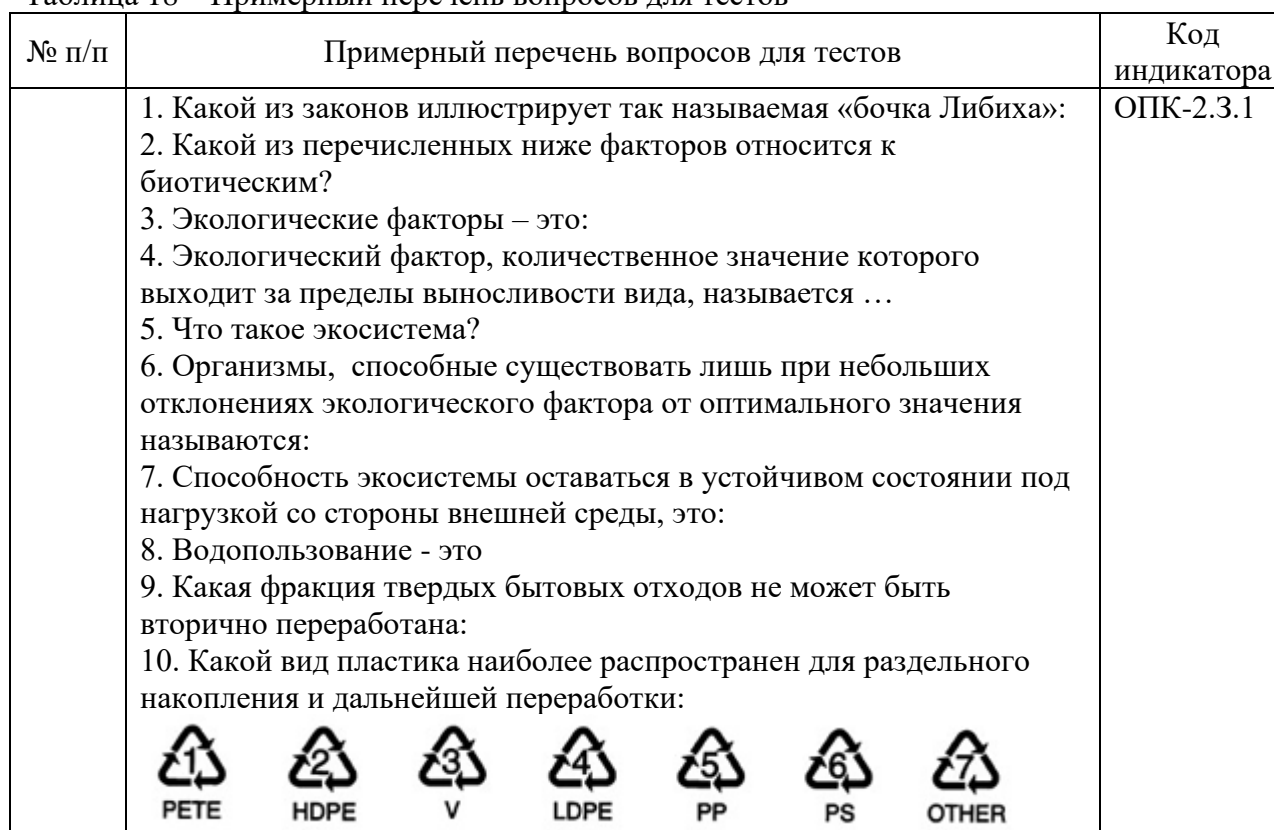
Таблица 18 – Примерный перечень вопросов для тестов

Перечень тем контрольных работ по дисциплине обучающихся заочной формы обучения, представлены в таблице 19.