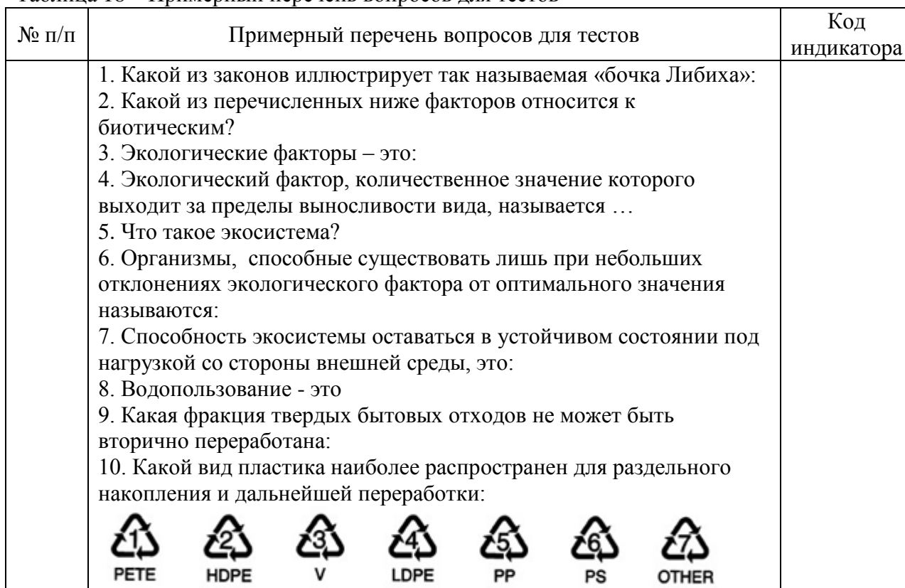
Таблица 18 – Примерный перечень вопросов для тестов

Перечень тем контрольных работ по дисциплине обучающихся заочной формы обучения, представлены в таблице 19.