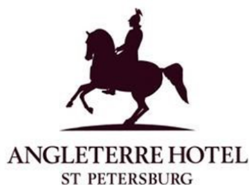
Рисунок 1 – Логотип гостиницы «Англетер»

6.5.5 Иллюстрации каждого приложения обозначают отдельной нумерацией арабскими цифрами с добавлением перед цифрой обозначения приложения: Рисунок А.3.