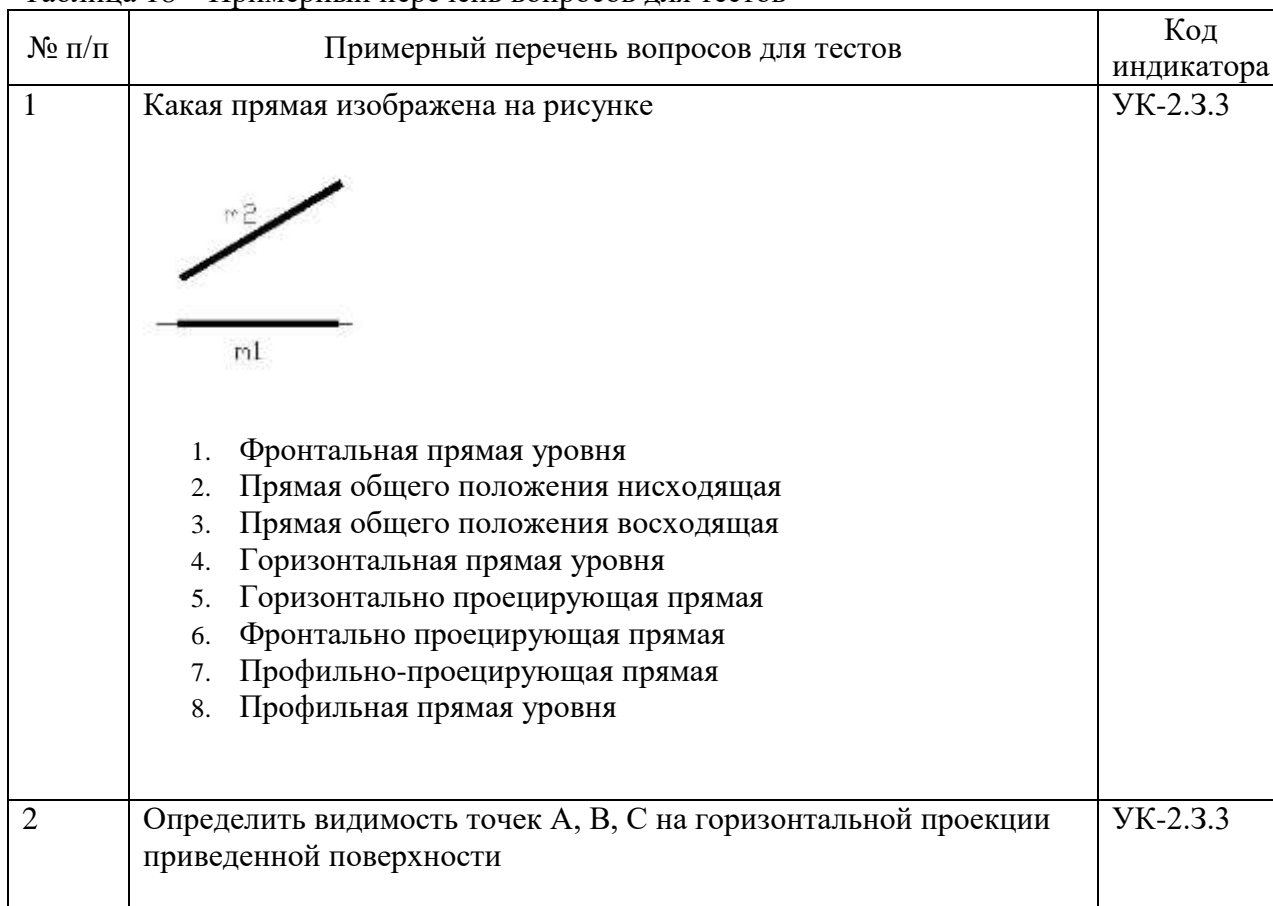
Таблица 18 – Примерный перечень вопросов для тестов

Вопросы для проведения промежуточной аттестации в виде тестирования представлены в таблице 18.