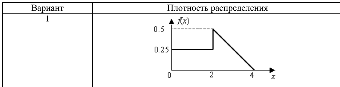
Таблица 20 – Вариант исходных данных

Кроме того предлагается оценить математическое ожидание и дисперсию полученной непрерывной случайной величины, а также построить частотную таблицу. Подробно с методикой выполнения лабораторных работ можно ознакомиться с помощью следующего интернет ресурса: Мурлин А.Г. Компьютерное моделирование: методические указания к лабораторным работам. – Краснодар: КГТУ, 2011.– 52 с. – URL: https://www.studmed.ru/murlin-ag-kompyuternoe-modelirovanie-metodicheskie-ukazaniya-k-laboratornym-rabotam_d469a0f4238.htm .