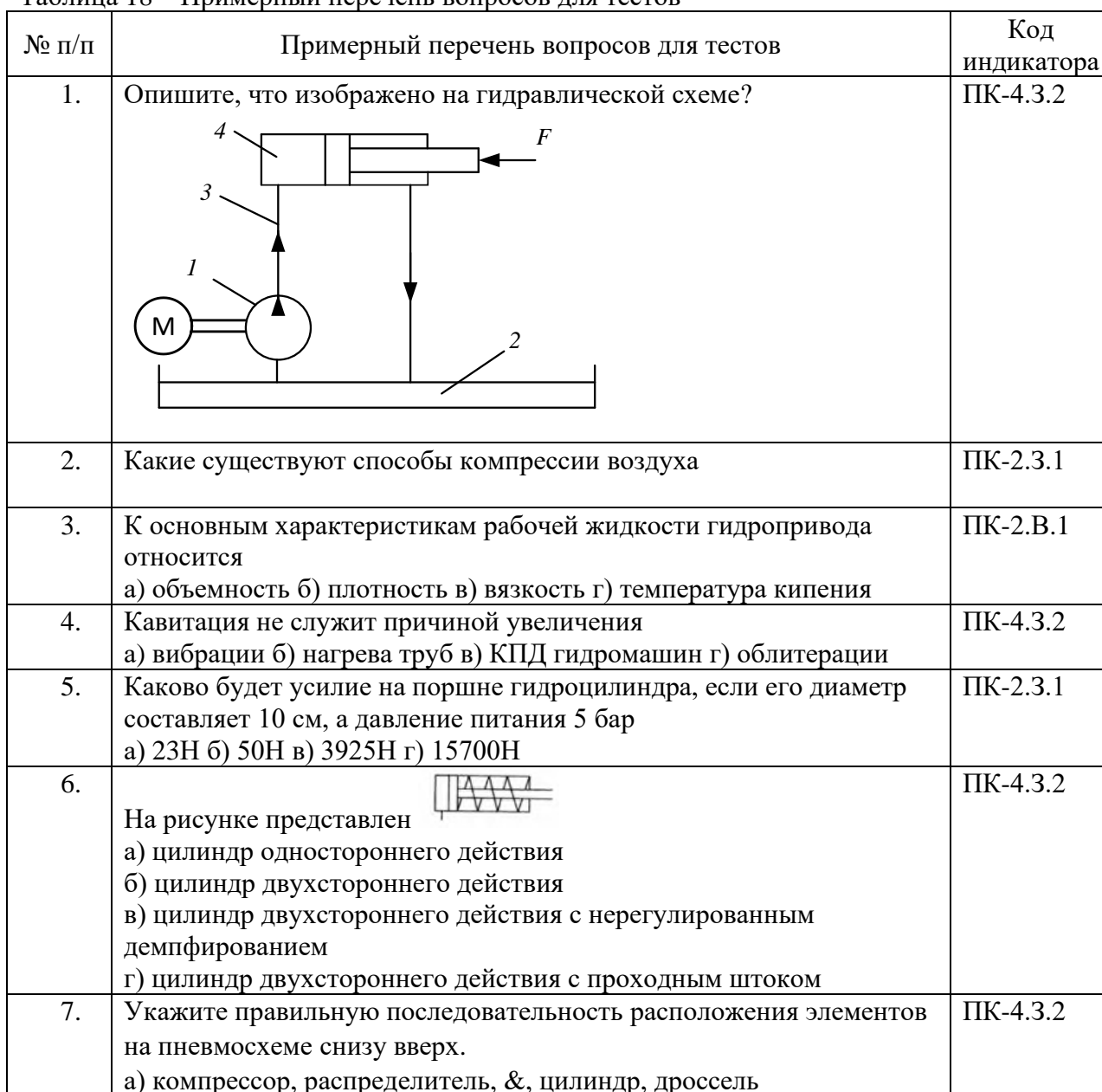
Таблица 18 – Примерный перечень вопросов для тестов

Вопросы для проведения промежуточной аттестации в виде тестирования представлены в таблице 18.