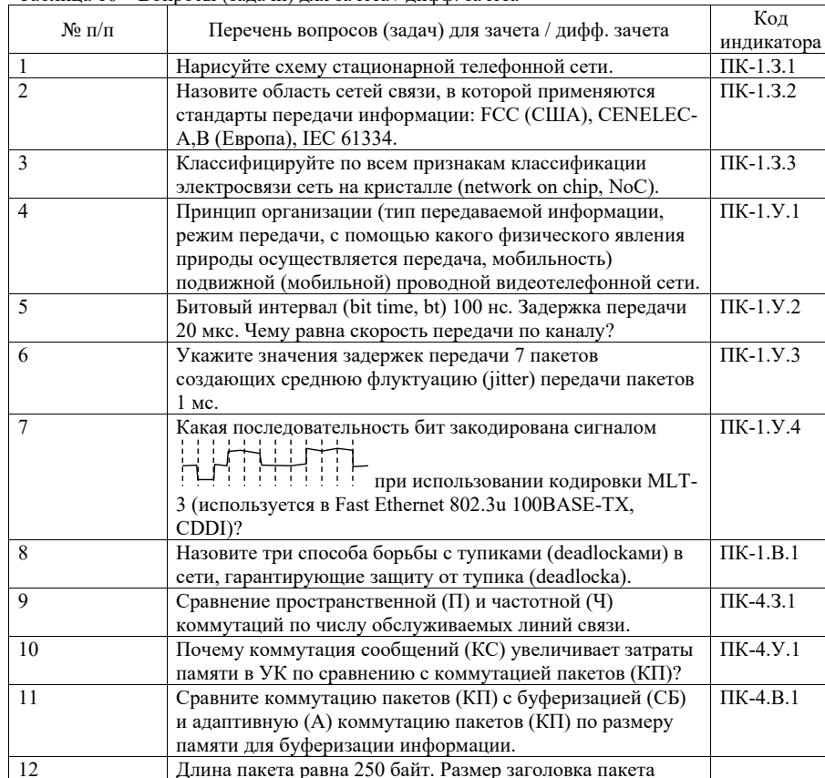
Таблица 16 – Вопросы (задачи) для зачета / дифф. зачета

Вопросы (задачи) для зачета / дифф. зачета представлены в таблице 16.