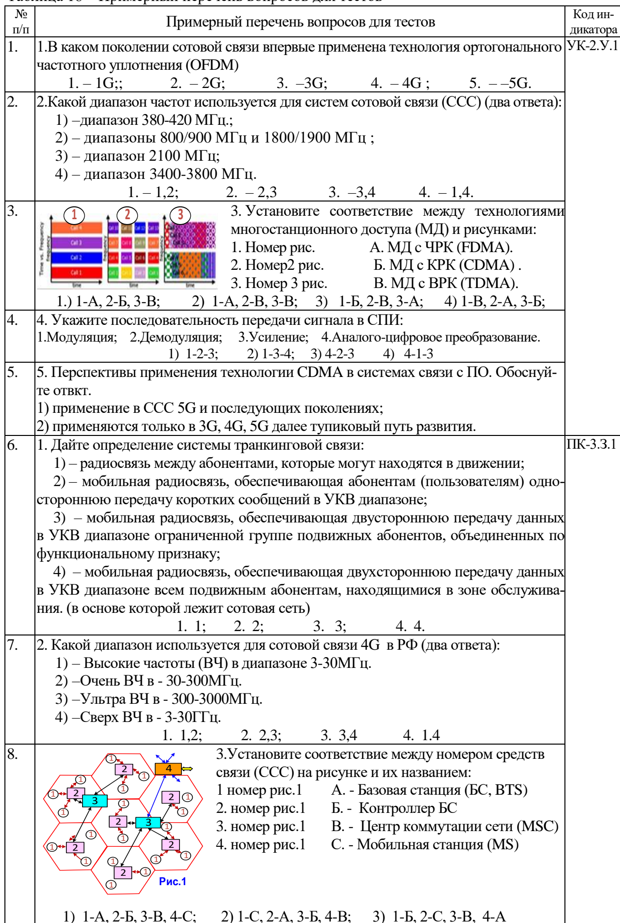
Таблица 18 – Примерный перечень вопросов для тестов