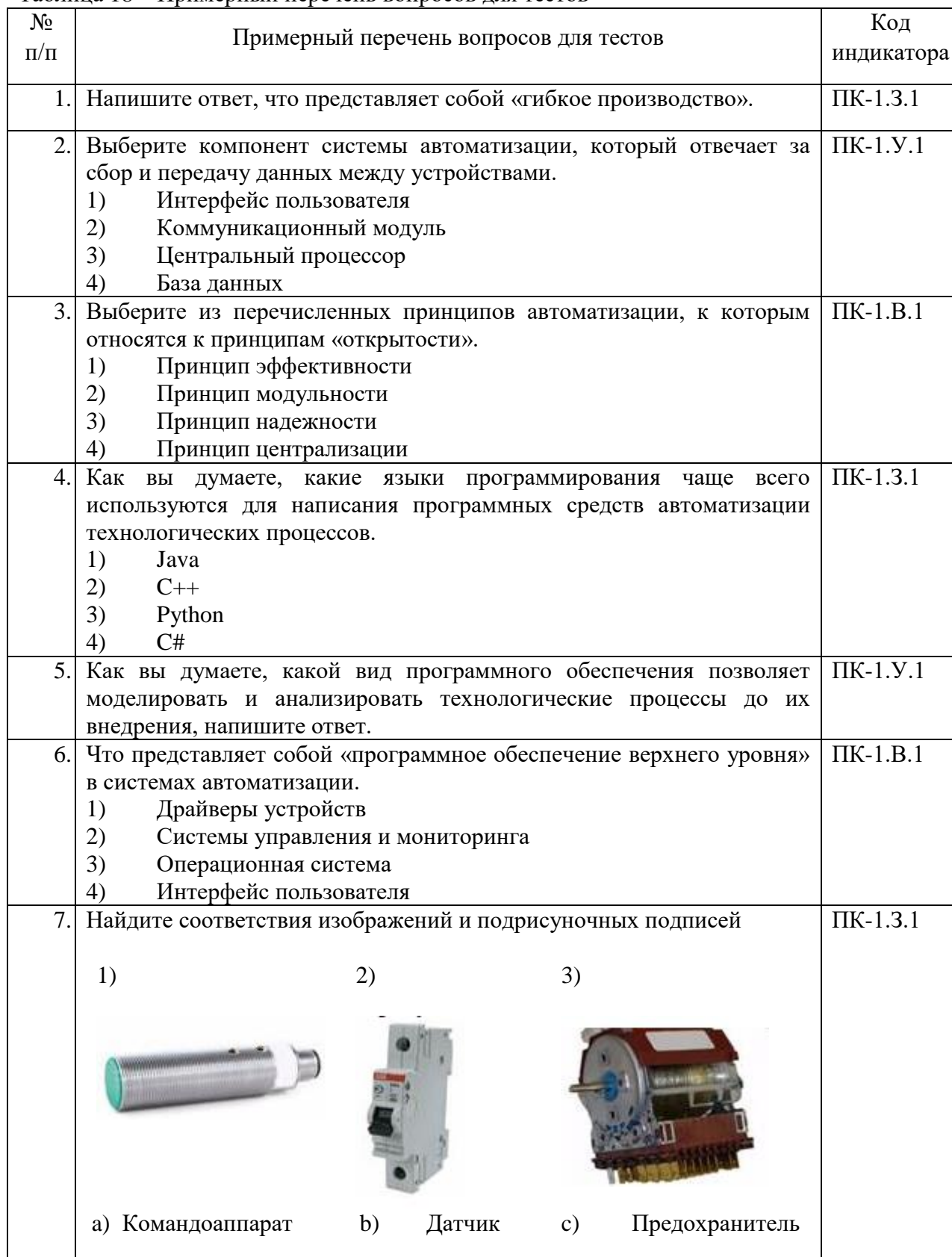
Таблица 18 – Примерный перечень вопросов для тестов

Вопросы для проведения промежуточной аттестации в виде тестирования представлены в таблице 18.