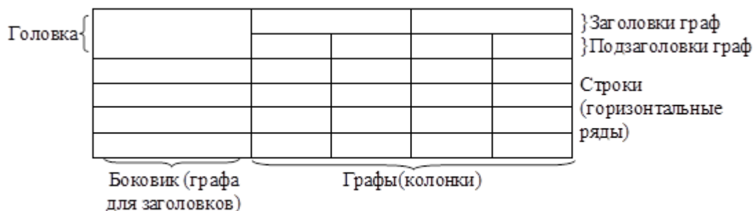
Рисунок 1 - Пример оформления таблицы

Таблица _____ - _____ номер название таблицы